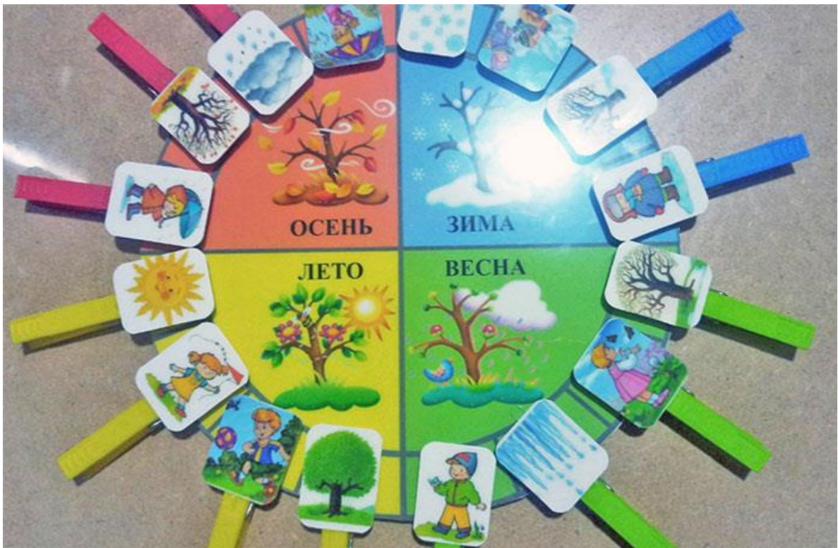
Игра с прищепками «Времена года»